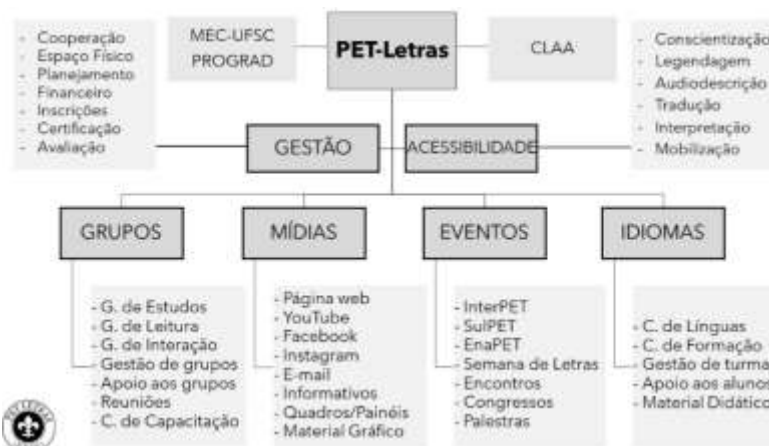
Estrutura Organizacional do PET-Letras em 2020