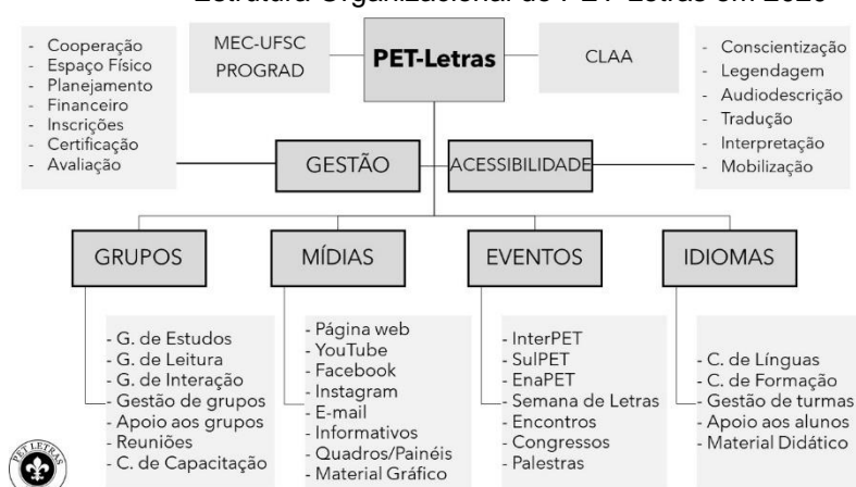
Estrutura Organizacional do PET-Letras em 2020